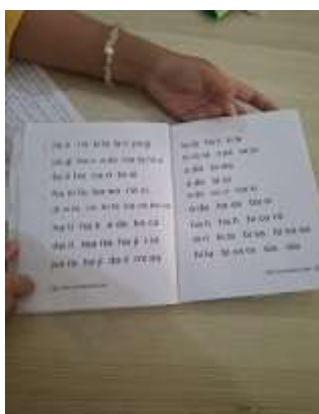
Gambar 3. Buku Saku Latihan Membaca

Deskripsi dari analisis data wawancara ini menggambarkan data yang diperoleh melalui analisis lembar observasi keterampilan berbicara pada siswa kelas II di SD Negeri Tambakaji 05 dengan narasumber guru kelas II SD Negeri Tambakaji 05 (Husna, 2020). Analisis observasi keterampilan berbicara siswa dilakukan secara deskriptif bertujuan untuk menggambarkan bagaimana keterampilan berbicara siswa kelas II di SD Negeri Tambakaji 05, Kecamatan Ngaliyan, Kota Semarang tahun pelajaran 2024/2025. Untuk mengambil hasil dari observasi berikut kami berikan deskripsi wawancara yang dilakukan untuk mengetahui data keterampilan berbicara siswa kelas II di SD Negeri Tambakaji 05.