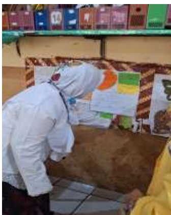
Gambar 4. Aktivitas Siswa Untuk Melatih Berbicara

Dalam pembelajaran Bahasa Indonesia di Kelas II SD Negeri Tambakaji 04 diarahkan untuk mengembangkan kemampuan siswa dalam memahami dan menggunakan bahasa sebagai alat komunikasi. Salah satu aspek utama, dalam keterampilan berbahasa adalah keterampilan berbicara, yaitu kemampuan siswa untuk mengungkapkan pikiran, ide, dan informasi secara lisan. Tarigan dalam Haryadi (1997:54) mendefinisikan keterampilan berbicara sebagai kemampuan mengucapkan bunyi-bunyi artikulasi atau kata-kata untuk menyatakan dan mengungkapkan pendapat atau perasaan kepada orang lain secara lisan (Rahmatiah, 2021). Namun, dalam praktiknya, pengembangan keterampilan berbicara siswa masih menghadapi berbagai kendala, terutama pada siswa kelas II di SD. Berdasarkan hasil observasi dan wawancara awal yang dilakukan di SD Negeri Tambakaji 05 ditemukan bahwa: