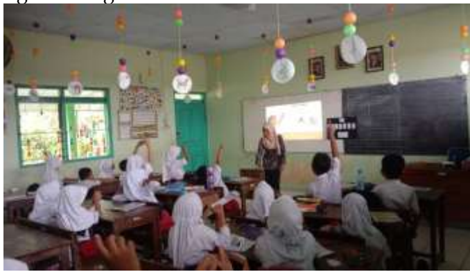
Gambar 1. Pelaksanaan Siklus 1

Pelaksanaan pembelajaran tindakan siklus I melalui pembelajaran membaca permulaan siswa menggunakan media flashcard, kegiatan selanjutnya adalah pemberian evaluasi akhir tindakan siswa kelas II SD 2 Mijen. Ketuntasan membaca secara menyeluruh adalah 50% atau 12 siswa. Dari 24 siswa yang mengikuti tes membaca akhir siklus I diperoleh nilai rata-rata 69. Data ini menunjukkan bahwa pembelajaran membaca permulaan belum memenuhi batas tuntas yang ditetapkan. Dengan demikian pada tes akhir siklus I ini pembelajaran membaca permulaan dapat dikatakan belum mencapai tujuan yang diharapkan. Hasil ini memberikan pengertian bahwa ketuntasan belajar masih belum terpenuhi karena hasil belajar dapat dikatakan tuntas apabila mencapai nilai 70 dan presentase bagi siswa yang tuntas mencapai 69%.