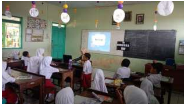
Gambar 2. Pelaksanaan Siklus 2

Pelaksanaan pembelajaran tindakan siklus II melalui pembelajaran membaca permulaan siswa menggunakan media flashcard, hasil evaluasi menunjukkan bahwa jumlah siswa tuntas 19 siswa atau 79%) dan siswa yang belum tuntas 5 siswa (21%). Siswa yang telah mencapai batas tuntas dengan nilai tertinggi 100 dan nilai terendah 40. Data ini menunjukkan bahwa pembelajaran membaca permulaan sudah mencapai batas tuntas yang ditetapkan. Berdasarkan hasil tersebut diketahui bahwa nilai rata-rata ketuntasan klasikal tes kemampuan membaca sudah memenuhi indikator.