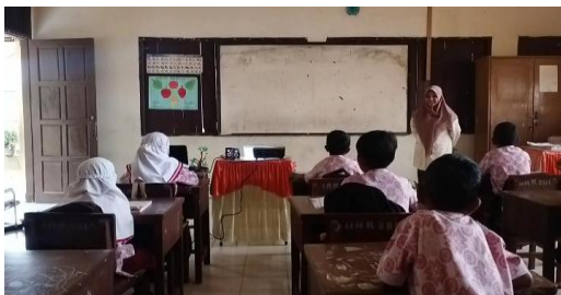
Gambar 7. Guru menjelaskan sistem belajar

Pembelajaran pada siklus II ini dirancang berdasarkan hasil refleksi pada siklus I. Ada beberapa kendala dan kekurangan pada siklus I yang dilakukan perbaikan pada siklus II. Untuk alur pembelajarannya masih sama dengan siklus I. Yang ada perubahan hanya pada teks yang digunakan dalam LKS serta instrumen tes yang digunakan pada akhir Tindakan siklus II sudah disesuaikan dan dikembangkan sesuai karakter dan tingkat inteligensi siswa.