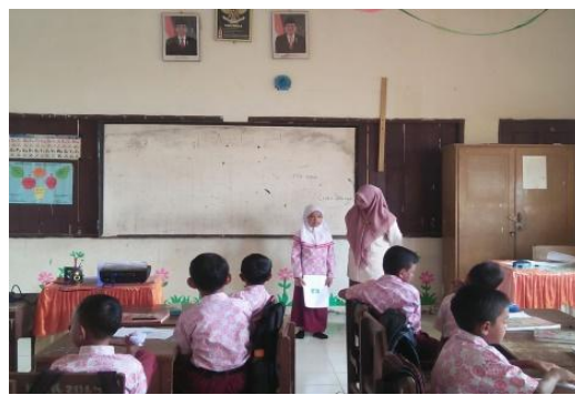
Gambar 11. Mempresentasikan hasil diskusi

Berdasarkan kegiatan pembelajaran pada siklus II didapatkan hasil kemampuan membaca pemahaman siswa seperti yang tertuang dalam tabel di bawah ini.