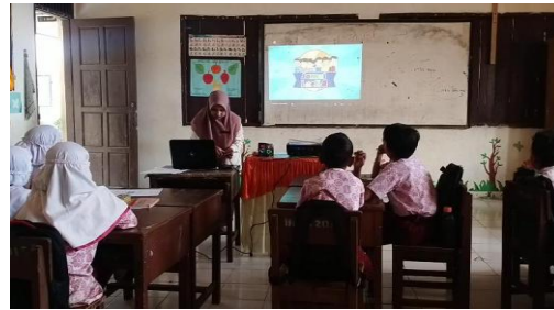
Gambar 9. Siswa menonton video animasi