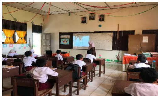
Gambar 2. Membaca teks dalam slide PPT