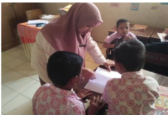
Gambar 10. Membimbing siswa berdiskusi