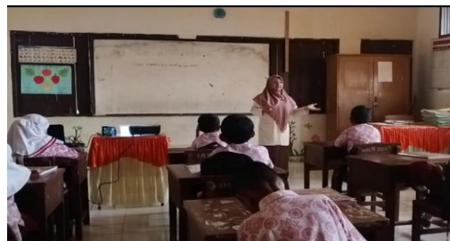
Gambar 8. Guru memberikan motivasi kepada siswa