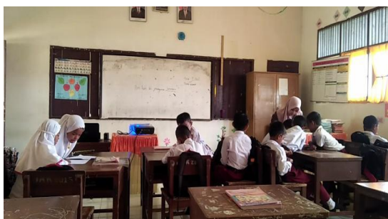
Gambar 5. Membimbing siswa berdiskusi mengerjakan LKS