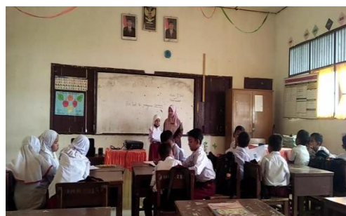
Gambar 6. Mempresentasikan hasil diskusi

Setelah pembelajaran selesai, siswa diberikan instrumen tes akhir Tindakan. Tes akhir tindakan ini dilakukan selama 40 menit. Masing-masing siswa diminta membaca secara nyaring 1 teks yang telah disiapkan secara bergiliran, kemudian setelah semua membaca, siswa diberikan soal berupa teks rumpang. Pada soal teks rumpang siswa diminta mengisi/melengkapi teks rumpang tersebut dengan jawaban yang benar. Selanjutnya, ada soal yang ketiga yaitu siswa diminta membaca satu teks utuh, diikuti dengan tiga pertanyaan yang harus dijawab oleh siswa di bawahnya. Pertanyaan tersebut jawabannya dapat ditemukan di dalam teks utuh yang telah dibaca sebelumnya. Berikut ini adalah data hasil tes akhir tindakan terhadap kemampuan membaca pemahaman siswa Kelas IISD Negeri 22 Peusangan.