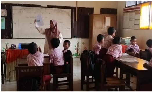
Gambar 8. Siswa membentuk kelompok belajar