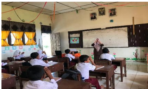
Gambar 1. Menyampaikan kompetensi yang ingin dicapai siswa