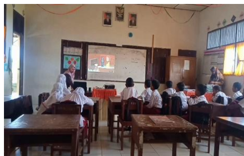
Gambar 4. Siswa menonton video animasi