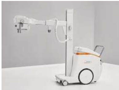
Gambar 4. Mobile X-Ray