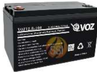
Gambar 2. Baterai

Baterai pada sistem PLTS berfungsi sebagai media penyimpan energi listrik yang dihasilkan dari konversi radiasi surya pada siang hari, sehingga dapat dimanfaatkan pada malam hari atau saat intensitas cahaya matahari rendah. Sistem ini menjalani siklus pengisian (charging) dan pengosongan (discharging) yang dinamis, tergantung pada ketersediaan radiasi UV untuk memastikan kontinuitas pasokan energy (A. W. Nardi, 2024).