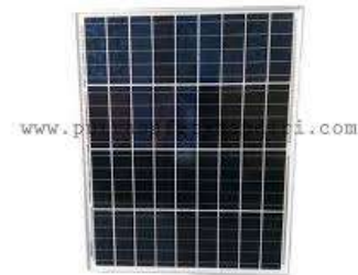
Gambar 3. Panel Surya

Komponen utama yang menyerap energi matahari dan mengubahnya menjadi listrik arus searah.