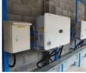
Gambar 1. Inverter